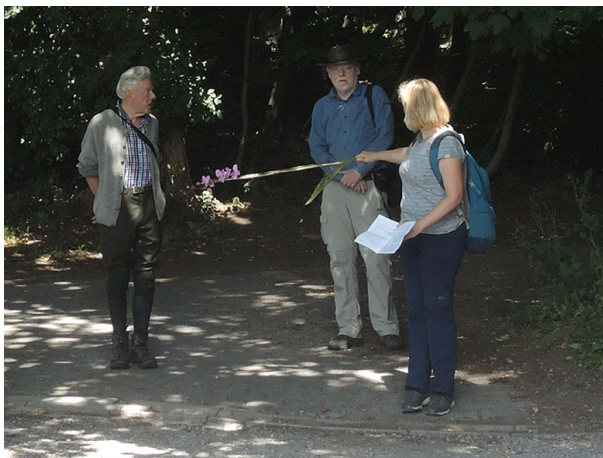
Abb. 1: Einhalten des Mindestabstands...