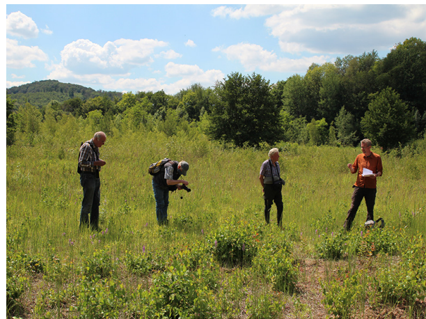
Abb. 2: ... auch im Gelände